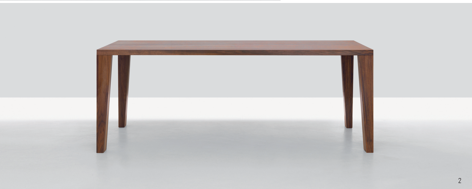
1,2 SLASH, amerikanischer Nussbaum